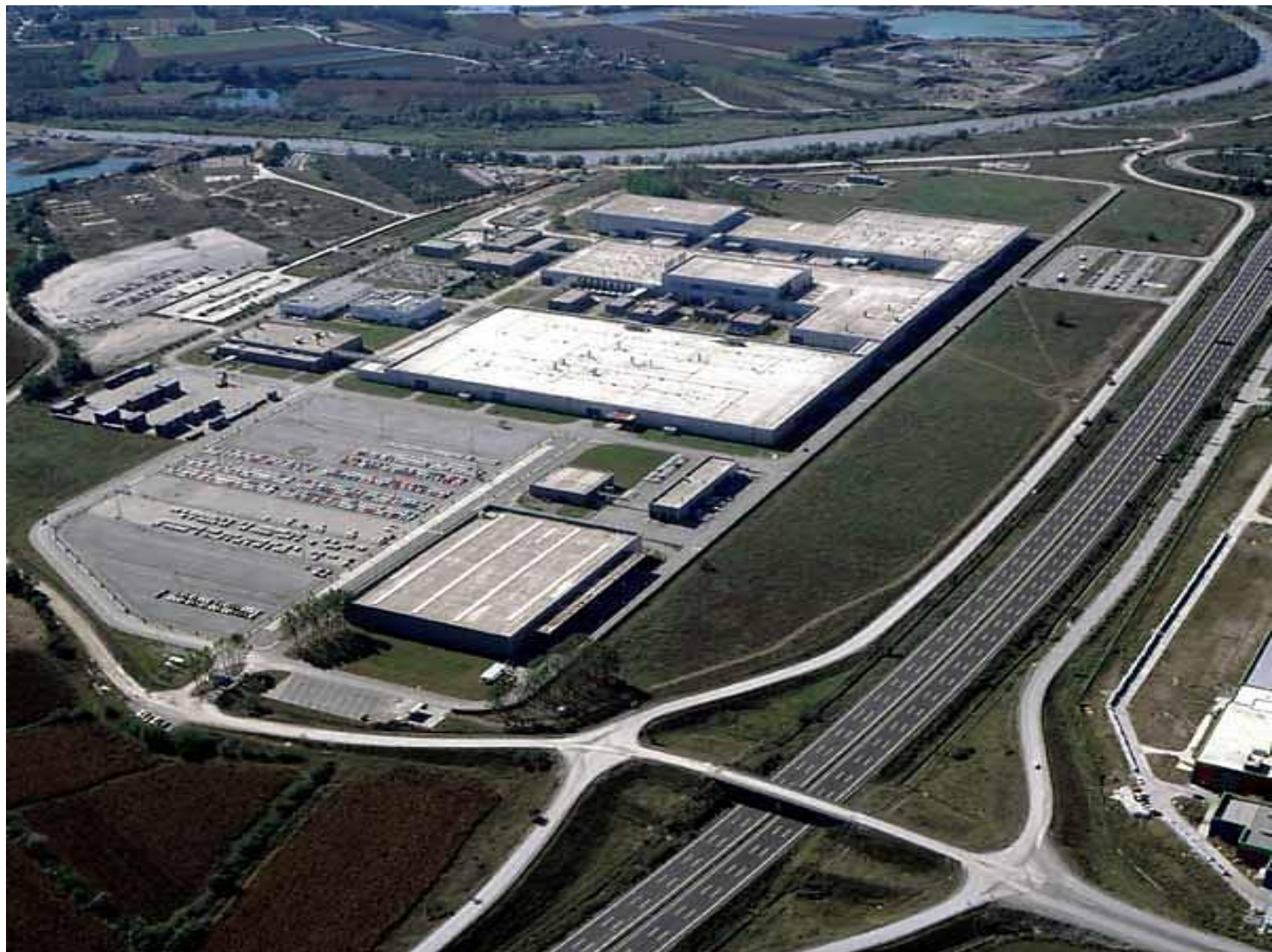
Usine Toyota Sakarya, Turquie